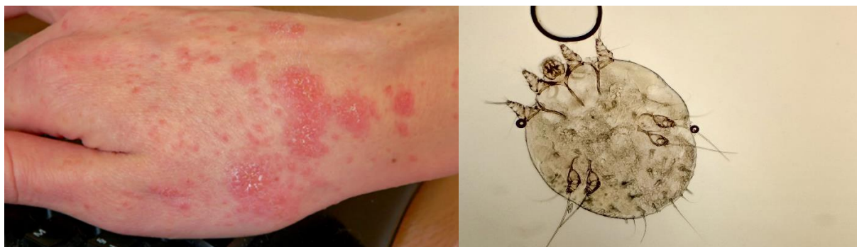
Kožní projevy – svrab na rukou