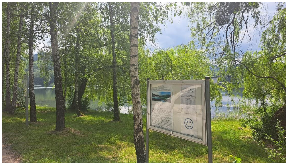
Informační tabule u VN Větrkovice, okres Nový Jičín, Foto: KHS

Aktuální informace o kvalitě vody ke koupání ve volné přírodě jsou k dispozici ZDE . Na všech sledovaných koupacích místech jsou rovněž k dispozici informační tabule, na kterých lze najít všeobecné informace o jednotlivých nádržích včetně hodnocení kvality vody.