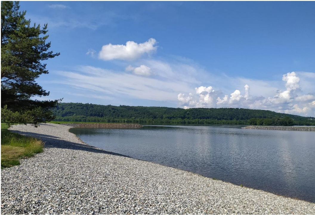
Štěrkovna Hlučín, okres Opava

Další ověření kvality vody, v souladu s monitorovacím kalendářem, zajistil provozovatel sportovně rekreačního areálu štěrkovny Hlučín. Kvalita vody v hlučínském jezeře vyhovuje požadavkům na koupání.