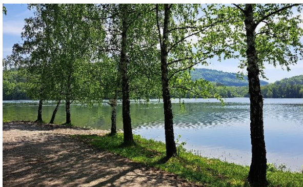
Vodní nádrž Větkovice, okres Nový Jičín, Foto: KHS

Začátkem tohoto týdne pokračovaly kontroly kvality vody na místech ke koupání v okresech Frýdek-Místek a Nový Jičín. Zaměstnanci KHS MSK odebrali vzorky vody na třech místech Žermanické přehrady, na dvou místech přehrady Olešná a v nádržích Brušperk, Větkovice, Kacabaja, Čerták a Údolí mladých.