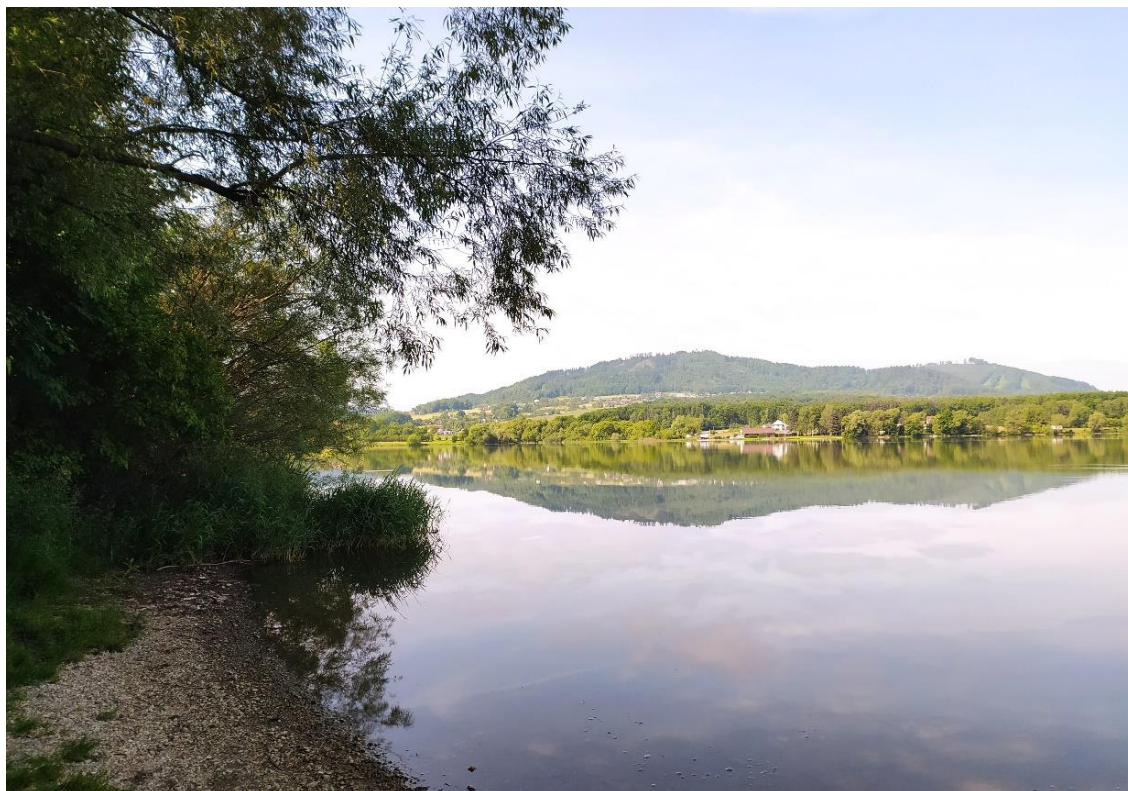
Vodní nádrž Olešná – Palkovice, okres Frýdek – Místek

Ve sledovaných nádržích nedošlo v kvalitě vody k zásadním změnám, pouze v případě vodní nádrže Olešná došlo ke zlepšení po senzorké stránce. Kvalita vody je vhodná ke koupání, s výjimkou vodní nádrže Brušperk. Na základě vyhodnocení mikrobiologických ukazatelů z předchozích 4 sezón, je voda zařazena do stupně „přijatelná“, proto je hodnocena oranžovým symbolem – zhoršená jakost s mírně zvýšenou pravděpodobností vzniku zdravotních problémů.